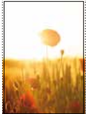
angeschnitten: Format 210 x 297 mm mit 3 mm Beschnittzugabe an allen Seiten