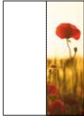
angeschnitten: Format 105 x 297 mm mit 3 mm Beschnittzugabe an den Randseiten