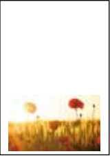
Format: 91 x 179 mm