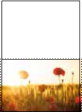
angeschnitten: Format 210 x 148,5 mm mit 3 mm Beschnittzugabe an den Randseiten