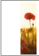
Format: 89,5 x 273 mm