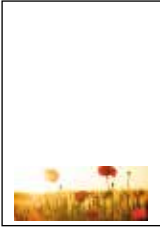
Format: 179 x 68,25 mm