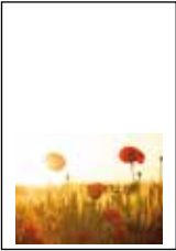
Format: 179 x 136,5 mm