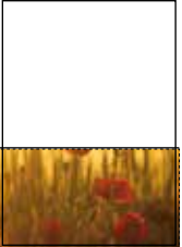
angeschnitten: Format 210 x 99 mm mit 3 mm Beschnittzugabe an den Randseiten